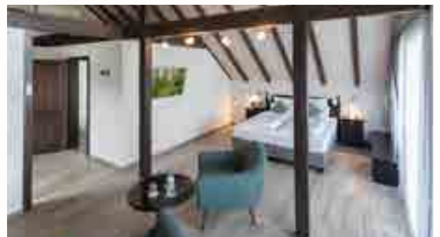
Studio Superior | Info-Tablet | klimatisiert mit Balkon und Kamin | 2-3 Personen