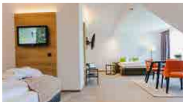
Studio Standard | Info-Tablet | 2 Fernseher | Sitzgelegenheit | Schlafsofa | 3-4 Personen