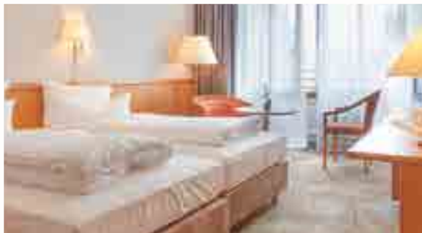
Doppelzimmer Standard getrennte Betten möglich