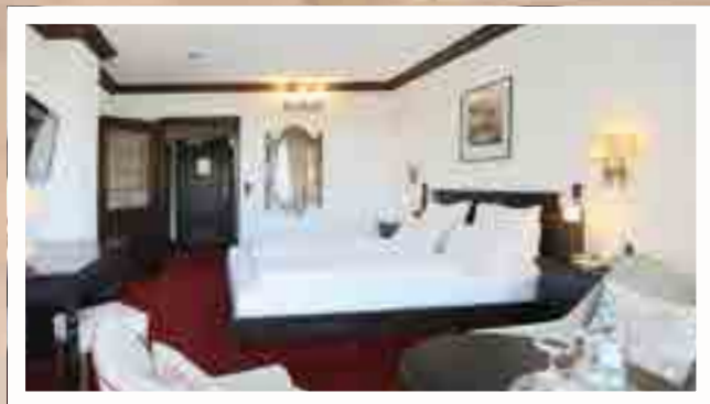
Doppelzimmer Superior mit Balkon