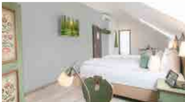
Studio Landhaus | Info-Tablet | klimatisiert |