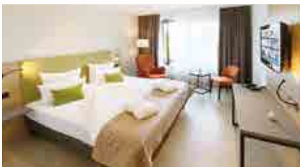
Doppelzimmer Superior mit Balkon